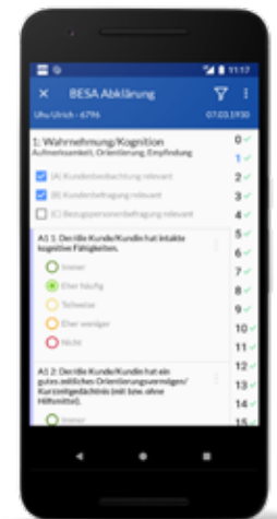
Nach der BESA Abklärung im Perigon Mobile wird daraus eine übersichtliche Netzgrafik erstellt.

Ihr root-Team info@root.ch | 071 634 80 40